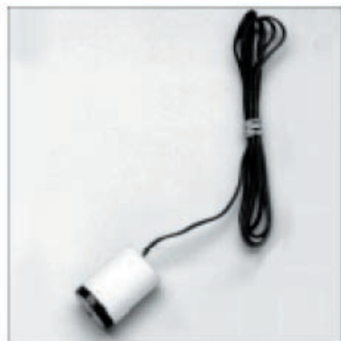
5201 シリーズ土壌水分ブロック

モデル5910A土壌水分計は、モデル5201石膏ブロックを手早く読み取るために使用される携帯用の機器です。モデル5201石膏ブロックは、直径2.2cmの小柄なデザインです。また、様々な長さのリードがご使用いただけます。